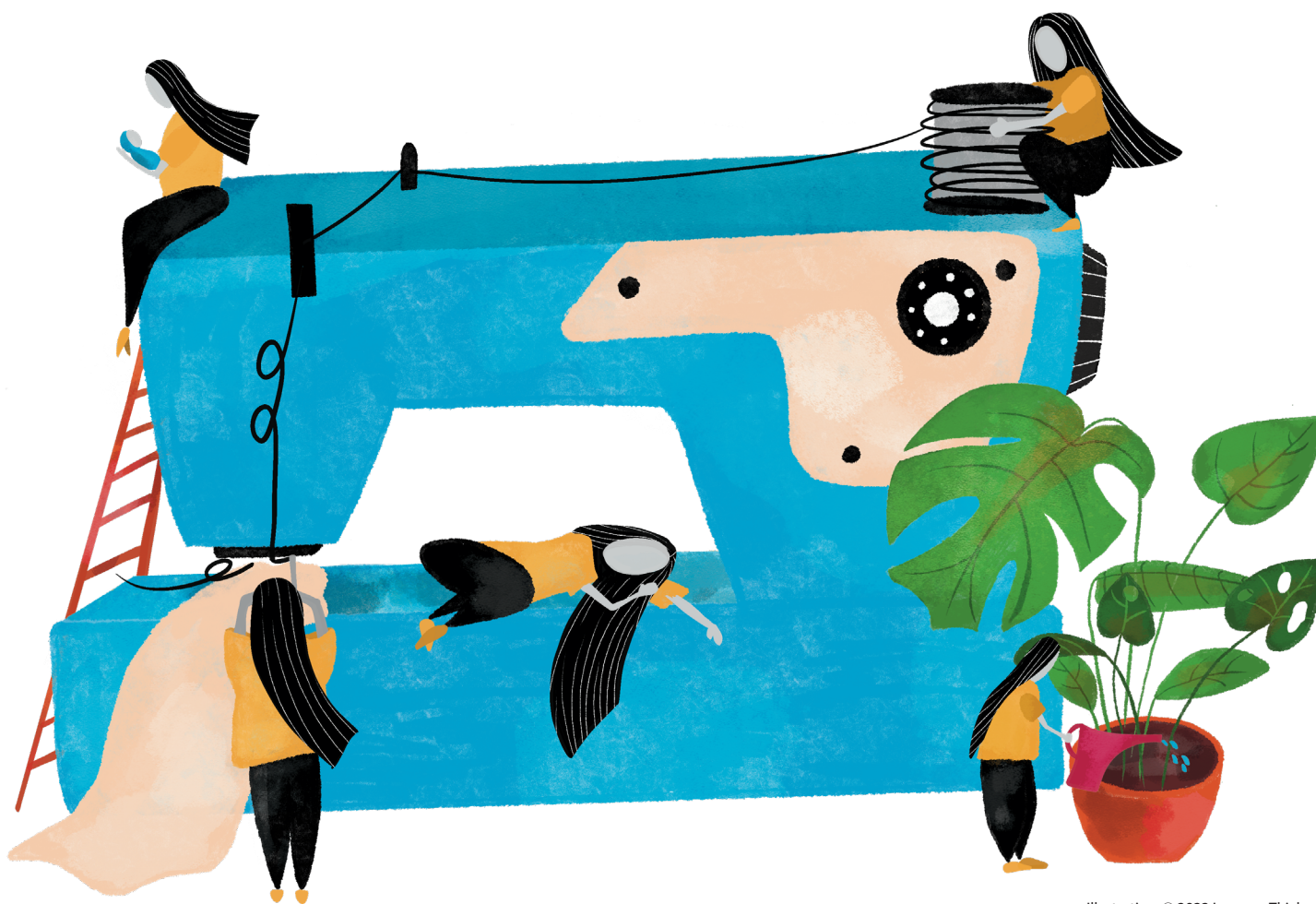
Illustration: © 2023 Jana van Thiel

Etwa 60% der ca. 94 Millionen weltweit beschäftigten Personen in der Bekleidungsindustrie sind Frauen.